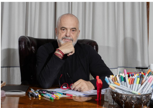
IL PRIMO MINISTRO EDI RAMA

Dopo dodici anni di crescita e modernizzazione, affronta la più dura sfida politica e reputazionale della sua leadership